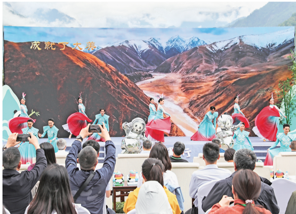
6月2日，在四川省雅安市宝兴县，演员在“美丽中国行之探访国家公园”集中采访启动仪式上表演。

一首歌曲、一套拳法、一桌饭菜……这些相隔万里的同频共振，这些普通人的鲜活日常，正汇聚成中非之间生生不息的回响。（新华社内罗毕6月2日电）